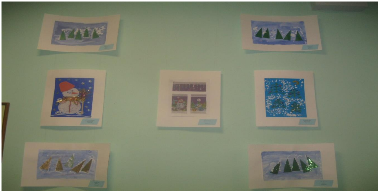
Выставка работ детей младшей группы №5 на тему: «Волшебный лес» МДОУ «Детский сад №29»